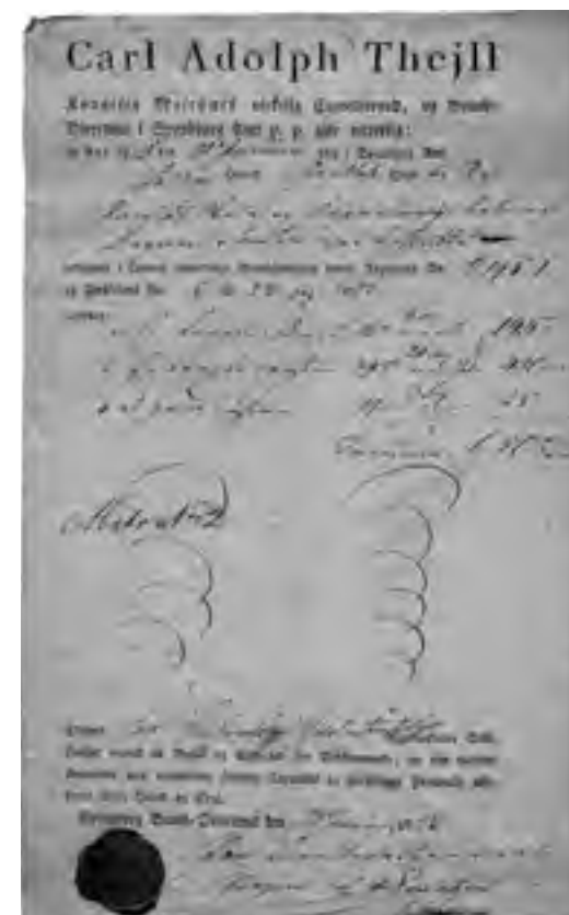
Forsikringspolice for Jordløse Skole og degnebolig 1825. Original forefindes på Jordløse-Trunderup lokalhistoriske arkiv.

I overensstemmelse med approberet plan af 1845 er denne hjælpeskole oprettet. Læreren, der tillige er organist i Jordløse kirke og herfor nyder en årlig løn af 16 rbd., er som skolelærer aflagt med en lønning af 120 rbd. samt 24 læs tørv til eget og skolens brug. Han antages på et halvt års opsigelse og skal være ugift. Han har fri bolig i skolebygningen, et nyt grundmuret hus, til hvilket med have og gymnastikplads er blevet udlagt et grundstykke på 2 skpr. land. Lærerens bidrag til hjælpekassen er ansat til 4 3 / 5 skpr. byg.