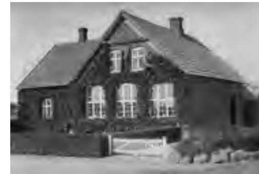
Herunder: Trunderupvej 59 1931. Bygget til forskole i 1913. Blev nedlagt som skole i 1965.