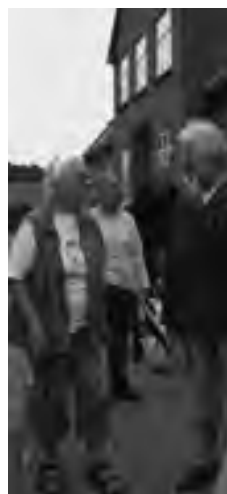
Fotos fra sommerens gåtur til Trunderup.