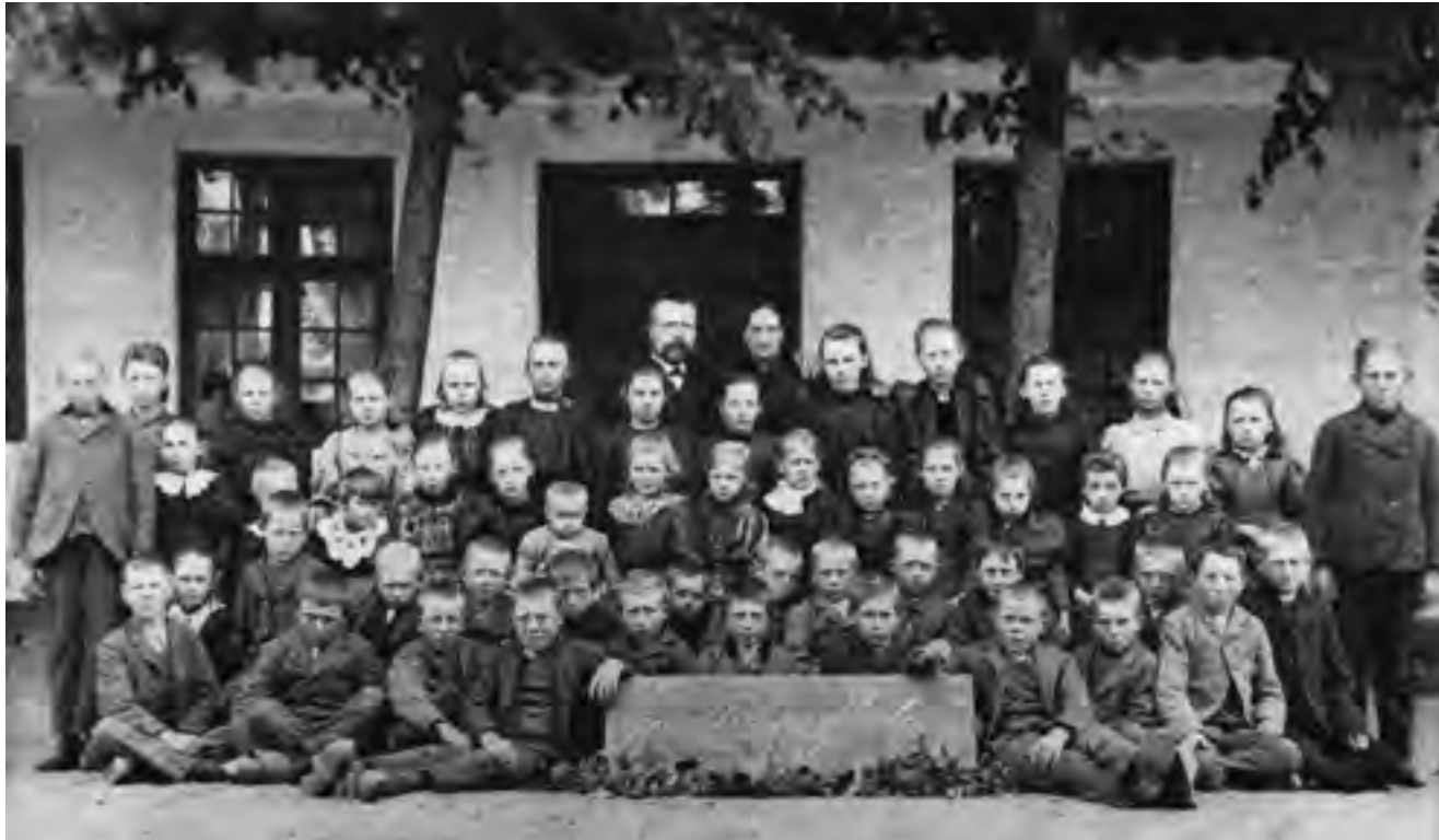
Herover: Elever og lærer foran skolen på Trunderupvej 63 1896. Her var skole indtil Trunderupvej 70 blev bygget i 1905.