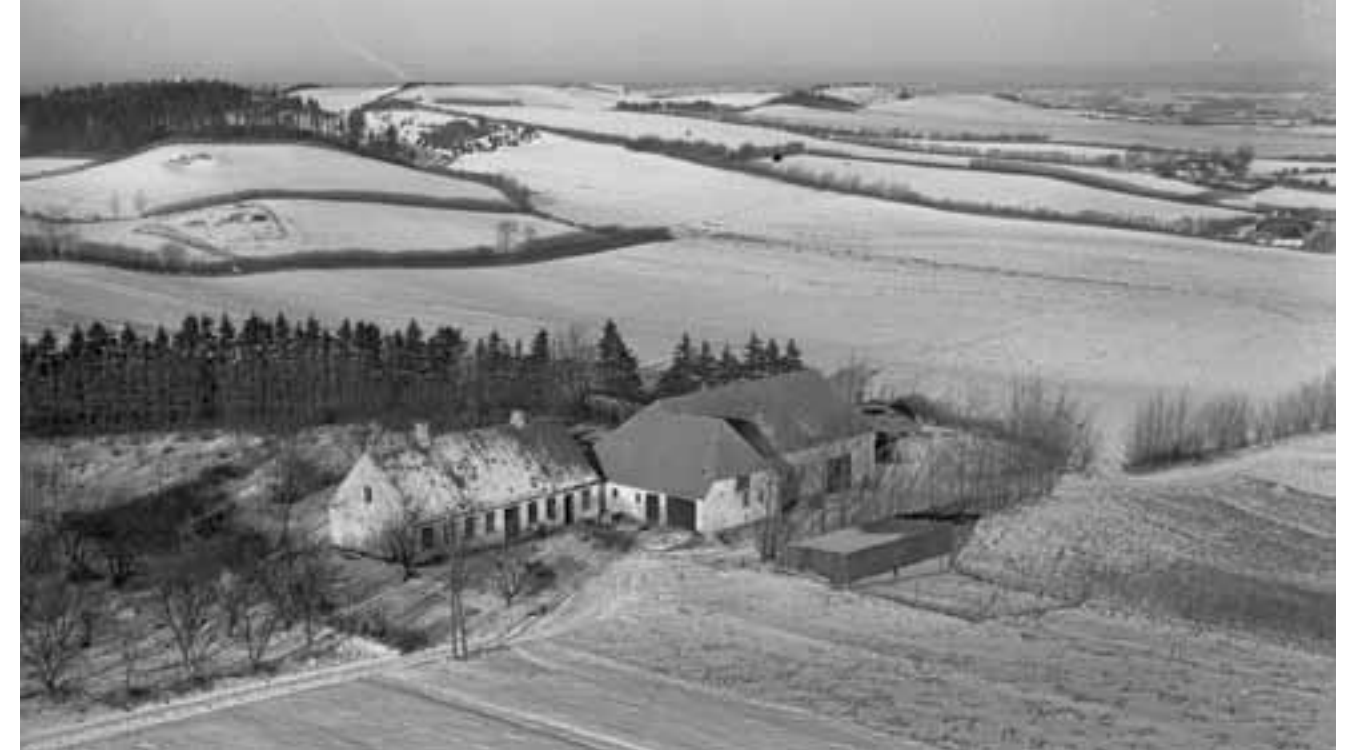
Herover: Holmelund 1950.

Gårdens drift er nu helt hobby-præget og det eneste landbrug der er tilbage er noget græssende kvæg på marken.