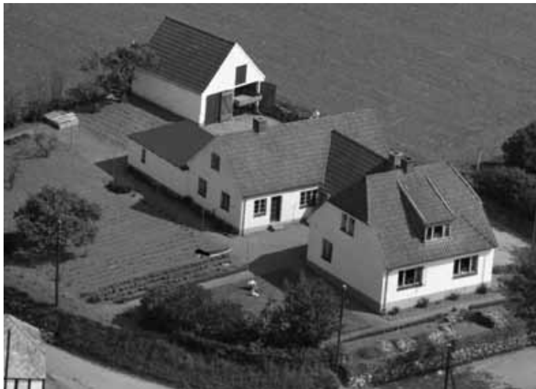
Til venstre: Luftfoto af Enghavevej 18. Som det så ud da Grethe og Poul Kyrping købte det. Sylvest Jensen Luftfoto 1959.