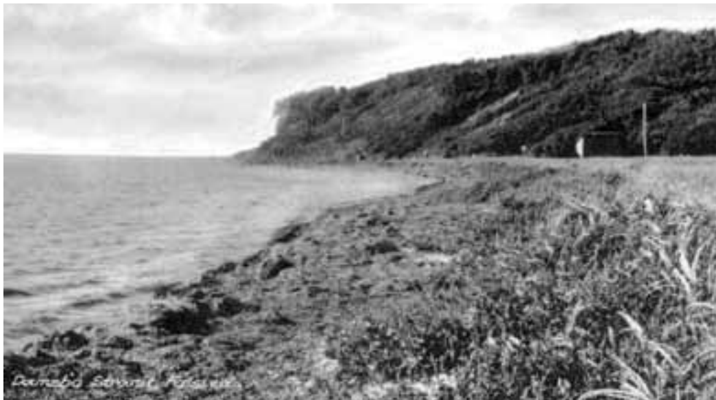
Til venstre: Postkort fra Damsbo Strand. Ishuset anes i bag- grunden. Det blev senere udskiftet med et større hus. Dette postkort er udgivet efter 1941 og sendt i 1957.