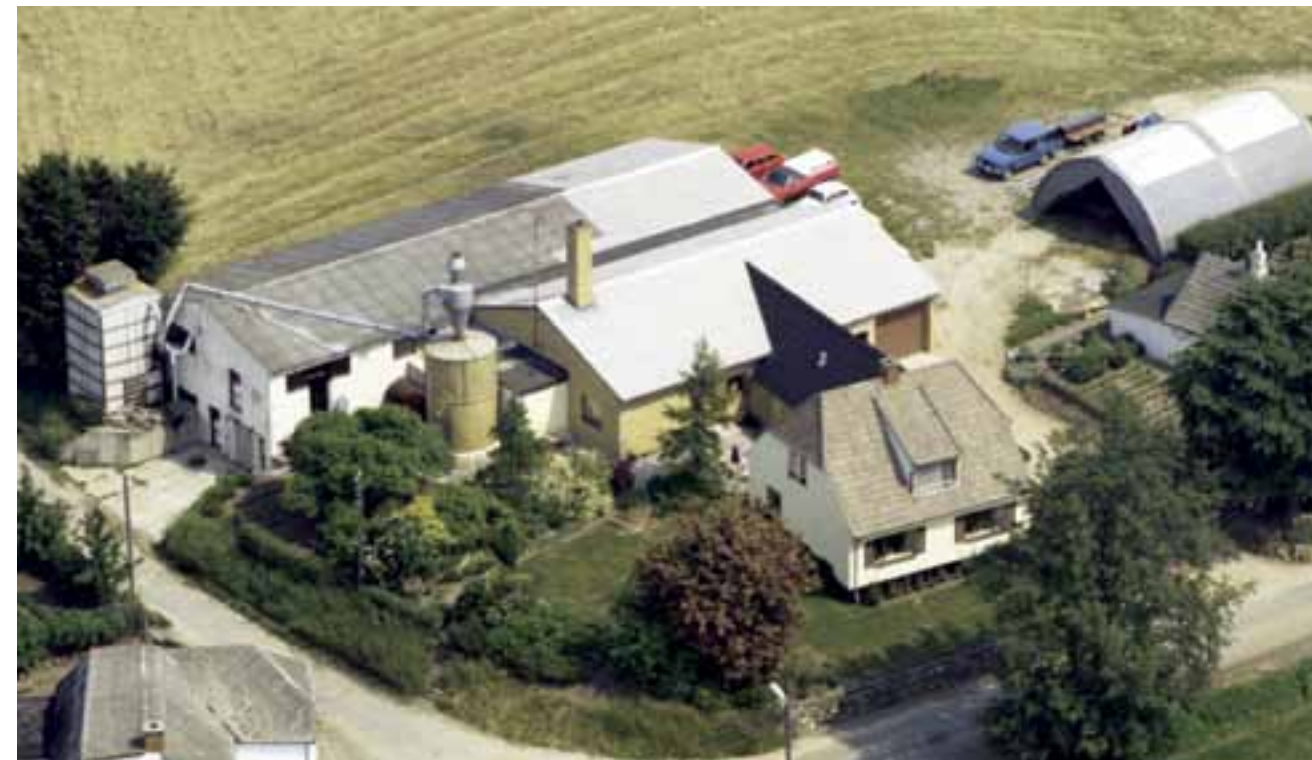
Til højre: Luftfoto af Enghavevej 18. Som det så ud 20 år senere.