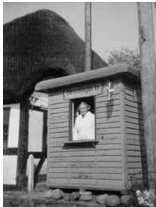
Til venstre: Ishuset på Landevejen 31.

På den lille trekant ved Landevejen 31 kunne der lige ligge et af de små gule is-