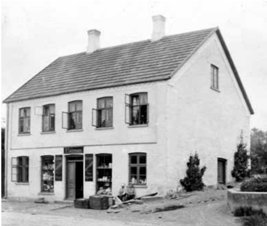
Til venstre: Lehrmanns køb- mandsforretning ca. 1910.