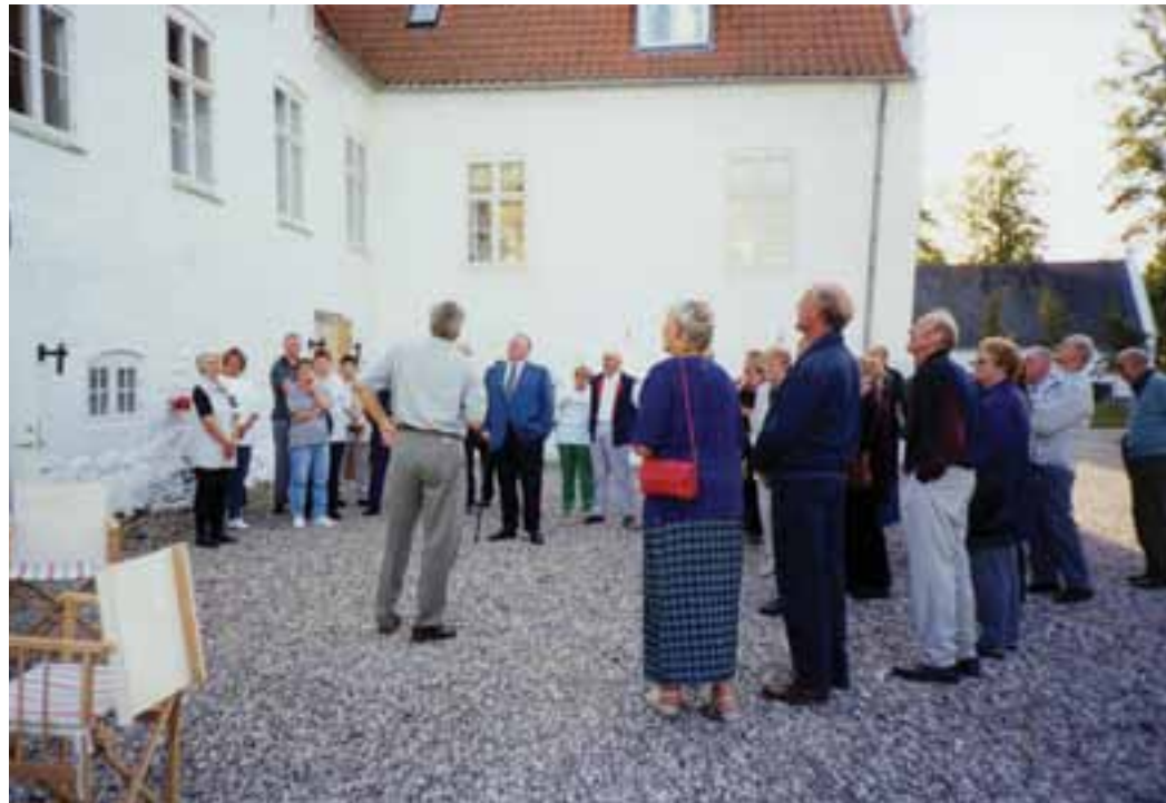
Til venstre: Fra lokalhistorisk Forenings udflugt til Søbo. Ca. 2000.