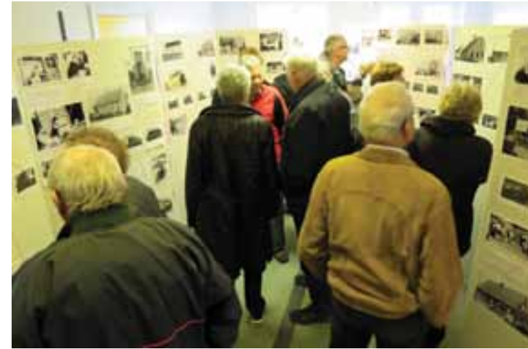
Herover: Udstilling om butikkerne på Landevejen i arkivets lokaler på Friskolen i Jordløse. 2015.

tede vi så arkivets indhold op på skolen i det nye arkiv.