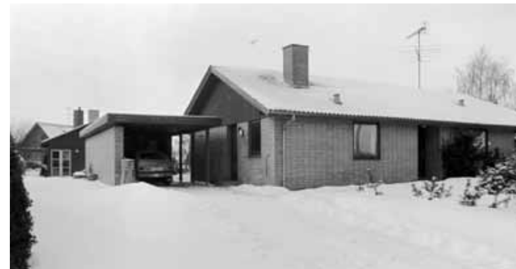
Til højre: Smedestræde 3.