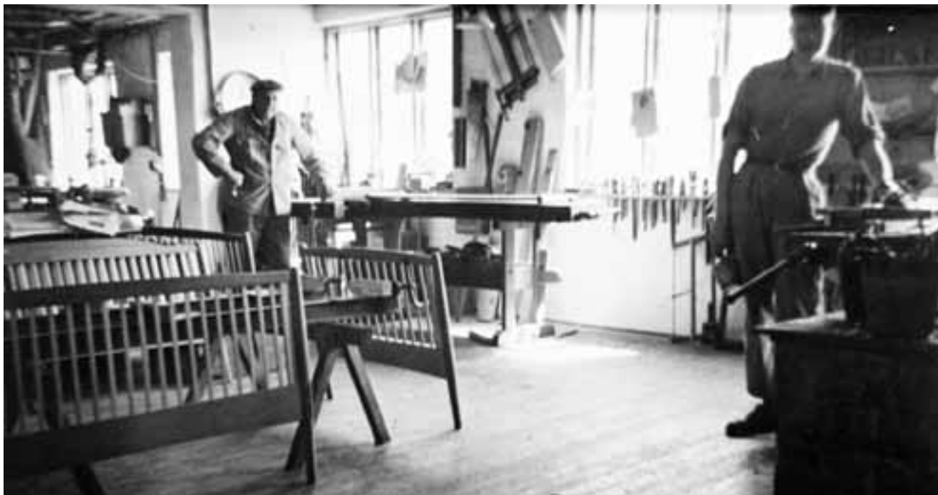
Herunder: Sengeproduktion i værkstedet Lande- vejen 38.