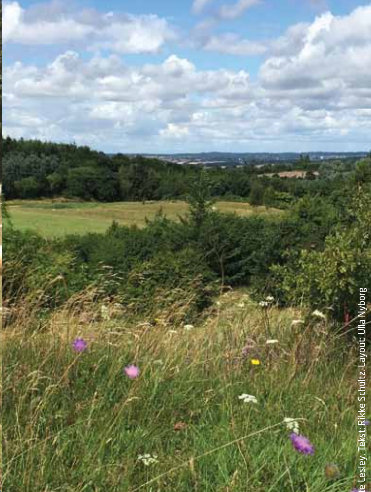
Tekst: Rikke Schultz. Layout: Ulla Nyborg